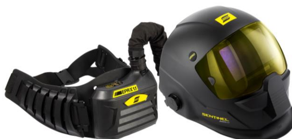
EPR-X1.1 con maschera per saldatura Sentinel A60 Air