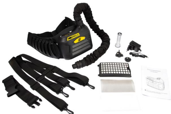
Sistema EPR-X1.1 PAPR

Visita esab.com per maggiori informazioni.